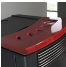
CERAMICA BORDEAUX (CON CAVILLO) BORDEAUX CERAMIC (WITH CRAZING)