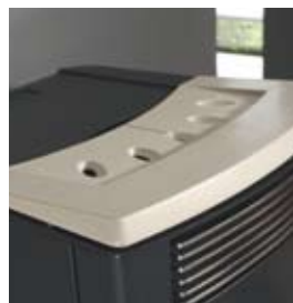
SALE E PEPE SALT AND PEPPER